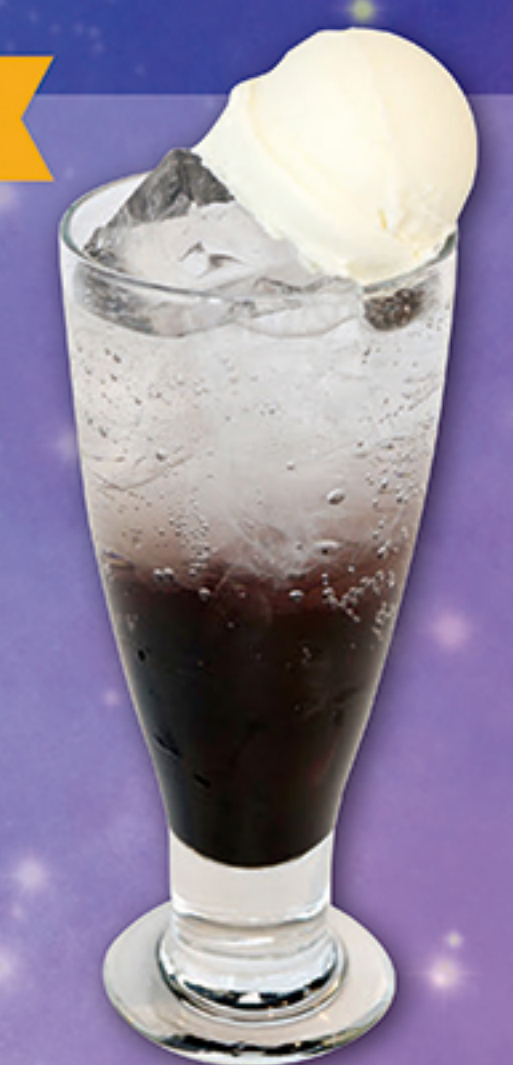
スペースソーダ ～ストロベリー味～ 380円 TAKE OUT