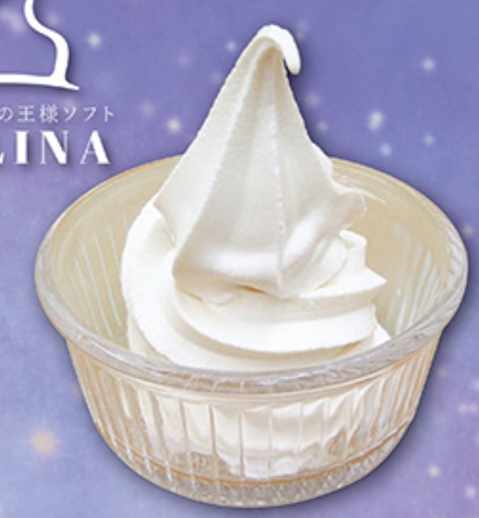
ピュアホワイト ソフトクリーム 500円 TAKE OUT