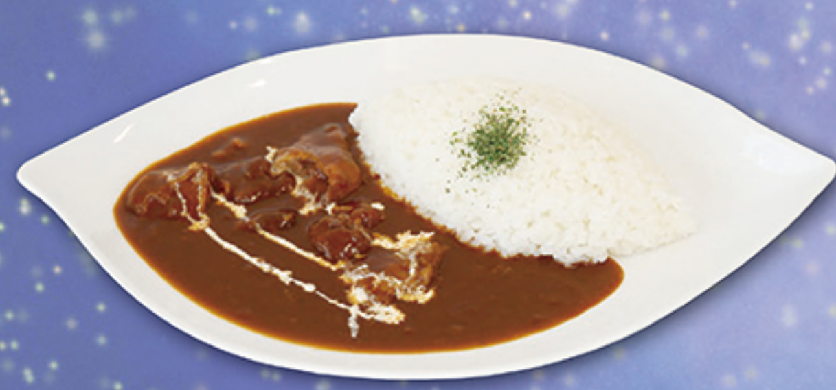
飛驒牛ハヤシライス 900円