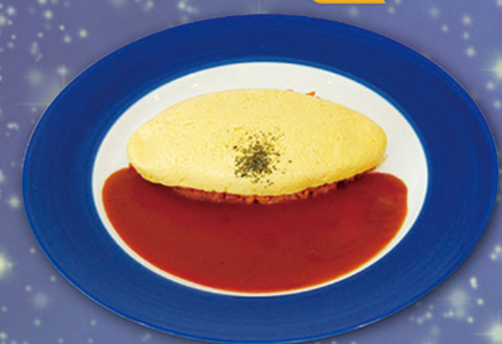
空宙博オムライス 950円