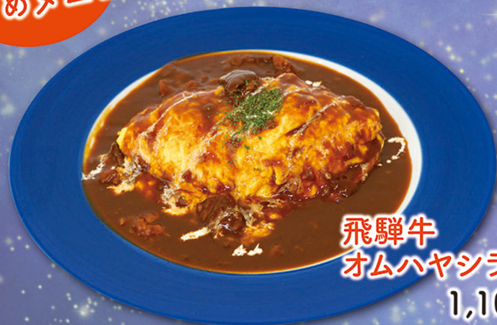
飛驒牛 オムハヤシライス 1,100円