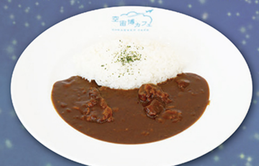
飛驒牛カレーライス 850円