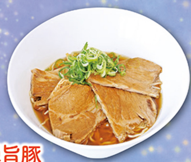
飛驒旨豚 自家製チャーシュー麺 900円