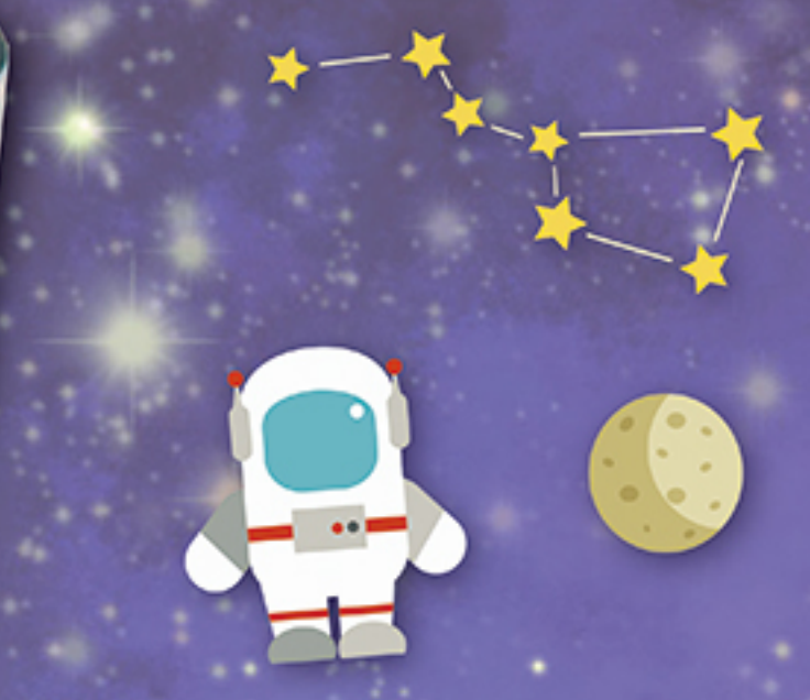
空宙ソーダ 400円 TAKE OUT