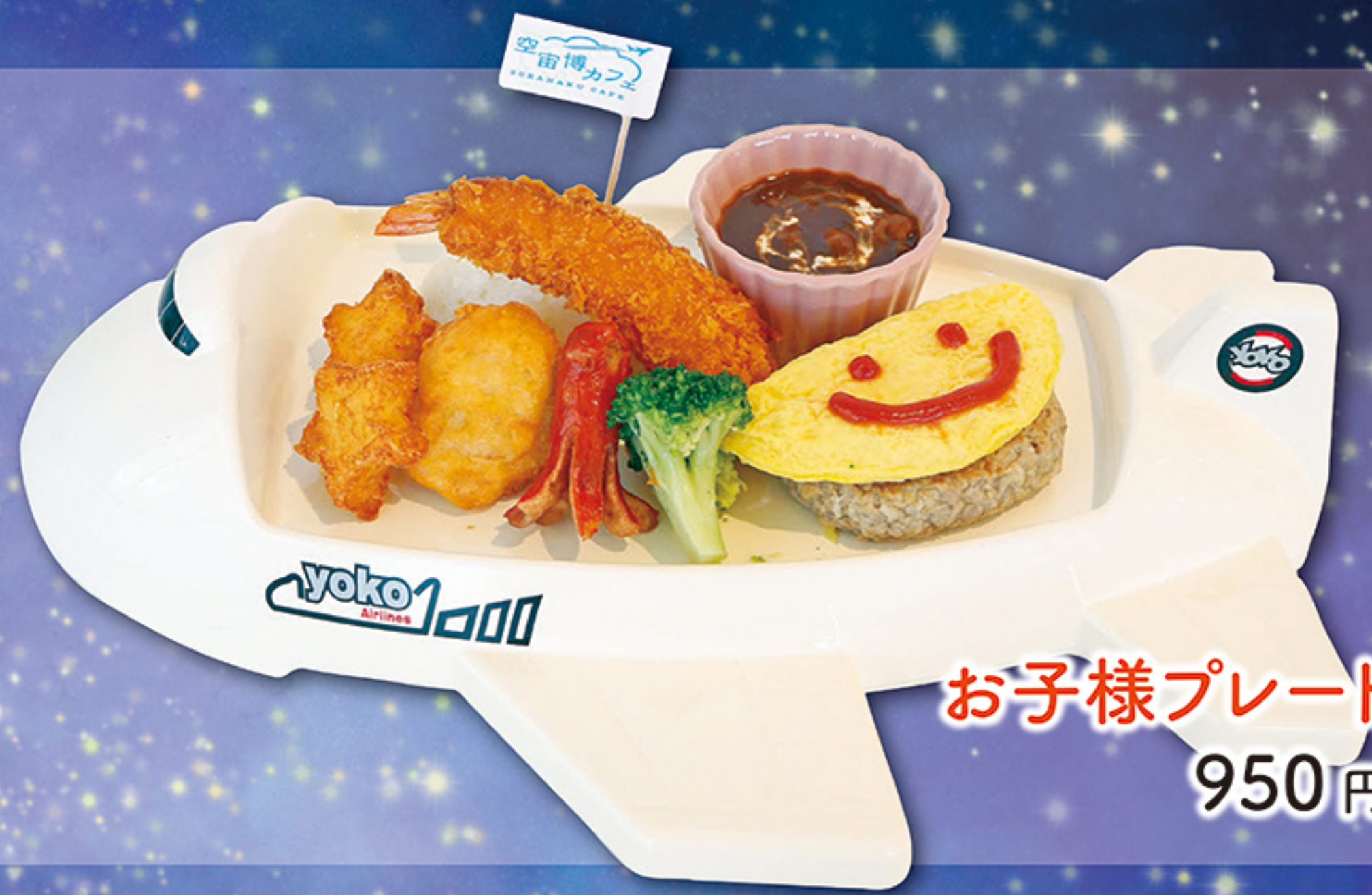
お子様プレート 950円